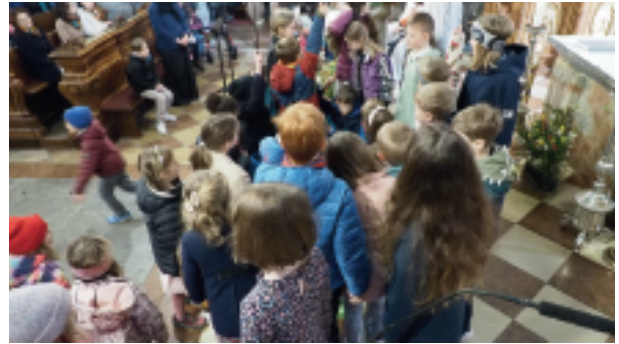
Kinder im Zentrum: bei den Familienmessen wimmelt es auch mal im Altarraum.