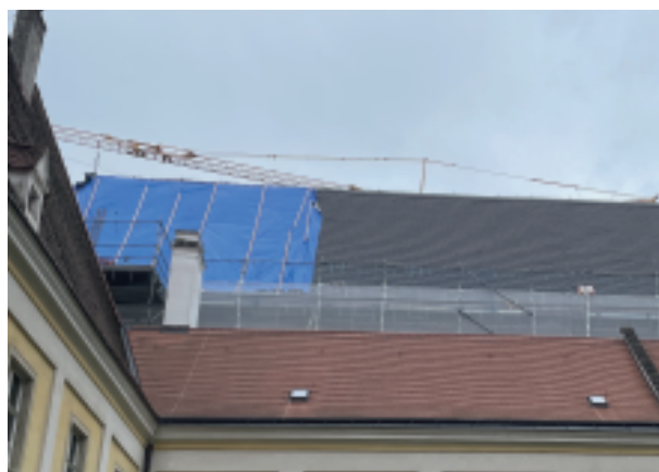
Besonders gut ließen sich die Dacharbeiten vom Kreuzgang aus beobachten.

Mit dieser Bauetappe wird ein bedeutender Abschnitt der Domsanierung umgesetzt und ein wichtiger Beitrag zum Erhalt unseres Gotteshauses für kommende Generationen geleistet.