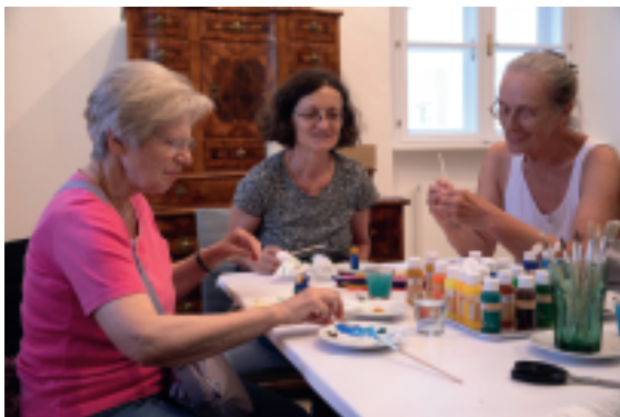
Ein Angebot des Museums am Dom: eine eigene Skulptur bemalen.